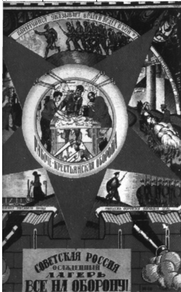
Плакат 1921 года

Центральный Комитет партии и Советское правительство повседневно занимались вопросами возрождения народного хозяйства. Многие видные деятели партии были направлены на хозяйствен-