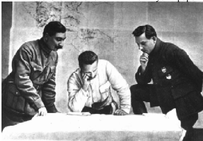
К. Е. Ворошилов, М. В. Фрунзе, С. М. Будённый над картой военных действий. 1920 год

13 августа началось восстание против советской власти под предводительством А. С. Антонова, охватившее всю Тамбовскую губернию. Съезд тамбовских повстанцев объявил советскую власть низложенной. В восстании участвовало до 15 тысяч человек, а в январе 1921 г. — более 50 тысяч человек. Советское правительство было вынуждено привлечь к борьбе с «антоновщиной»