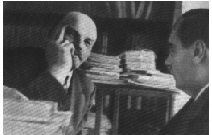
В. И. Ленин в своем кабинете в Кремле беседует с английским писателем Гербертом Уэллсом.

В октябре в ходе частных операций польские войска продвигались в восточном направлении значительно медленнее. 12 октября после разгрома войск Западного фронта и отступления армий