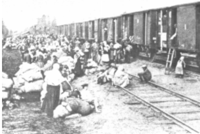
Беженцы на станции Желобовка Украина, 1919–1920 гг.

дело борьбы против общего врага. Между империалистической Англией и империалистической Россией существовали глубокие противоречия. Именно этими империалистическими противоречиями объясняется то, что в Лондоне задолго до революции разрабатывались планы ослабления России и отстранения ее от участия в решении европейских дел после окончания войны».