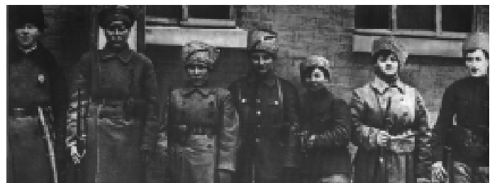
Группа молодых работниц из Харькова перед отъездом на фронт. Фото 1919 г.

16 марта умер Я. М. Свердлов, председатель ВЦИК, распространились слухи, что якобы 7 марта на митинге в Орле рабочие забросали его камнями и от полученных ушибов Свердлов уже не смог оправиться. Умер на самом деле от эпидемического гриппа. Похоронен у Кремлевской стены. Декретом СНК «О потребительских коммунах» создан единый распределительный аппарат: потребительские кооперативы объединялись в Потребительские Коммуны, руководимые Центральным союзом потребительских коммун («Центросоюзом»).