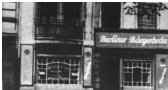
В этом берлинском доме посланцы 13 стран Европы учредили Коммунистический Интернационал Молодежи (КИМ).

20-26 ноября в Берлине проходил I Международный конгресс молодежных организаций, был создан Коммунистический Интернационал Молодежи (КИМ).