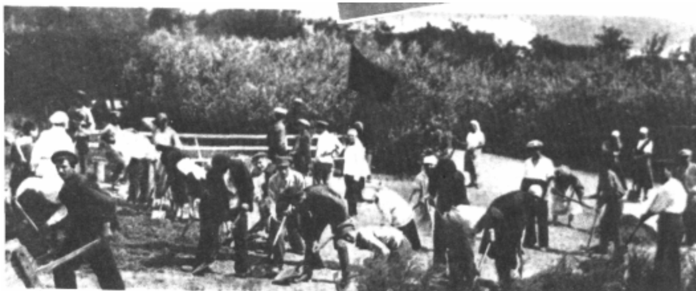
Комсомольский субботник в Новороссийске