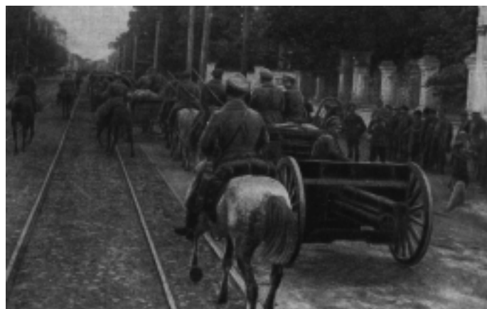
Вступление Красной Армии в Казань. Фотография. 1918 г.

Только в ответ на белый террор, который применяли контрреволюционеры, Советская власть объявила красный террор. ВЧК стала грозой врагов Советской власти, обнаженным мечом революции. Империалистические правительства и пресса развернули в связи с объявлением красного террора клеветническую кампанию против Советского государства, старательно замалчивая, что к суровым мерам борьбы Советская власть перешла в силу необходимости и лишь после того, как сами империалисты начали вооруженную интервенцию, а внутренняя контрреволюция развязала гражданскую войну.