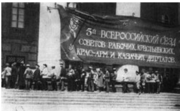
Делегаты 5-го Всероссийского съезда Советов идут на заседание. Фотография.

4 июля начал работу 5-й Всероссийский съезд Советов рабочих, крестьянских, солдатских и казачьих депутатов в Москве. Собралось 1164 делегата. Большевиков было среди них 773, левых эсеров — 353. Эсеры выступили против комитетов деревенской бедноты и продотрядов. Никогда, ни на одном съезде, ни на одном собрании не разыгрывались столь острые конфликты между соратниками — большевиками и левыми эсерами. Левые эсеры усиленно готовили мятеж в Москве. Поводом для него должно было послужить убийство германского посла Мирбаха. В качестве основной вооруженной силы они предполагали использовать один из отрядов ВЧК под командованием левого эсера Д. И. Попова. В конце июня — начале июля Попов направил на фронт почти всех преданных Советской власти бойцов и вместо них набрал деморализованных матросов Черноморского флота и анархистов. В соответствии с намеченным планом главари левых эсеров попытались выставить в Большом театре на время съезда свою охрану. Их настойчивость насторожила Свердлова, руководившего практической подготовкой съезда. Не подав левым эсерам виду, что их возня замечена, он согласился предоставить им возможность участвовать