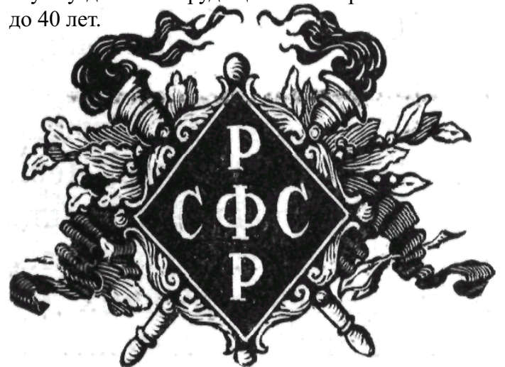
Заставка из первого издания Конституции РСФСР 1918 г.