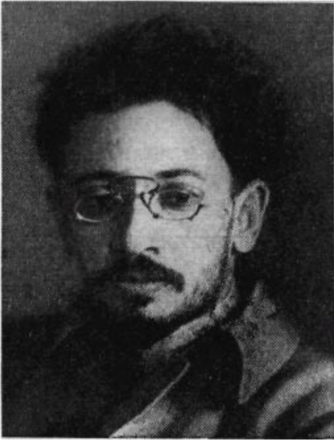
Руководители большевиков: Я. М. Свердлов