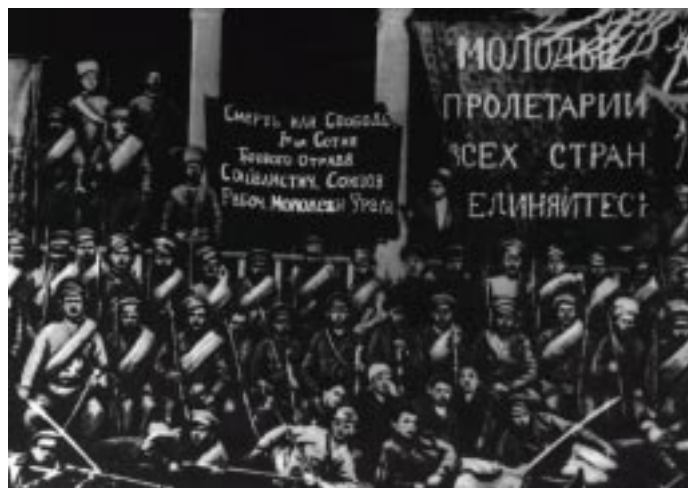
Рабочая молодежь Урала, 1918 г.

Имея большинство в Московском областном бюро, они попытались превратить московскую партийную организацию в свою опору в борьбе против Центрального Комитета. Узкий состав Московского областного бюро РСДРП (б), куда входили Ломов, Манцев, Сапронов, Оболенский (Осинский), Яковлева, принял постановление о недоверии ЦК «ввиду его политической линии и состава». «Мы считаем целесообразным идти на возможность утраты Советской власти, становящейся теперь чисто формальной». Однако немцы продолжали своё наступление на Белоруссию и на Украину.