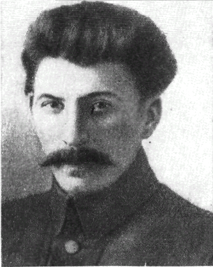
Руководители большевиков: И. В. Сталин (Джугашвили)