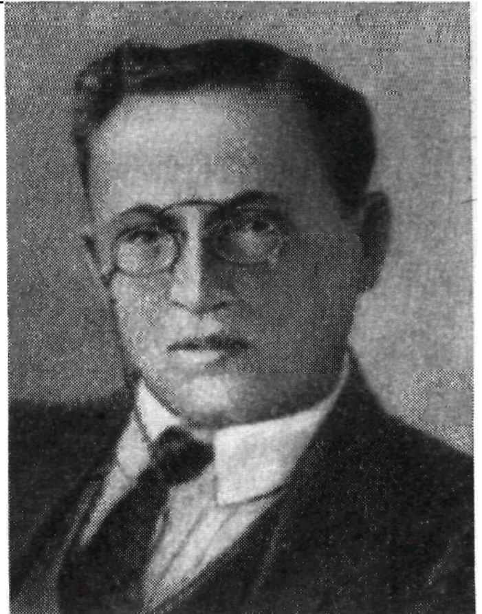
Руководители большевиков: М. С. Урицкий

Прибалтику вплоть до Нарвы и оказать вооруженную поддержку Финляндии. На совещании придумали и формальную мотивировку отказа от перемирия. Решено было считать, что «неподписание Троцким мирного договора автоматически влечет за собой прекращение перемирия» (Людендорф, Мои воспоминания, стр. 134, т. II, Госиздат. М., 1924). На заседании ЦК РСДРП(б) Ленин с большим трудом добился принятия решения в пользу заключения мира.