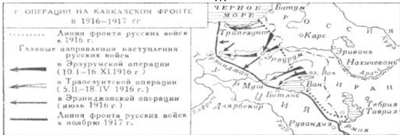
Операции на кавказском фронте в 1916-1917 гг.

К концу августа русские войска были сильно ослаблены и измотаны многодневными боями. Наступление юго-западного фронта оттянуло с западного и итальянского фронтов свыше 30 пехотных и более 3 кавалерийских дивизий австро-венгерских и германских войск, чем облегчило положение союзников и спасло итальянскую армию от разгрома у Трентино. Наступил перелом войны в пользу Антанты. Кавказский фронт стабилизировался западнее Трапезунта и Эрзурума.