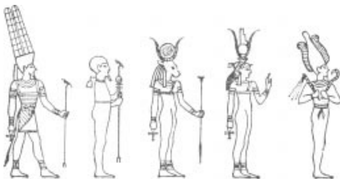
Египетские боги и богини. Слева направо: Амон, Птах, Хатор, Изида, Осирис.