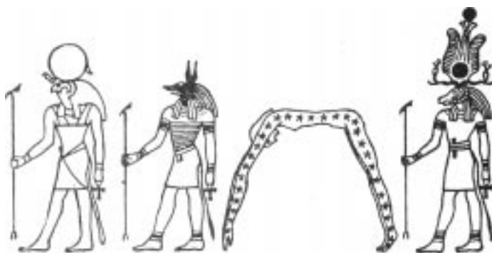
Египетские боги и богини. Слева направо: Ра, Анубис, Нут, Хнум.

В той или иной форме древнеегипетские боги-жрецы, носили на головах рога, это могли быть и длинные уши тотемных животных. Древние египтяне поклонялись быкам, кошкам, крокодилам, баранам и т. п. и считать их богами, так же как своих царей.