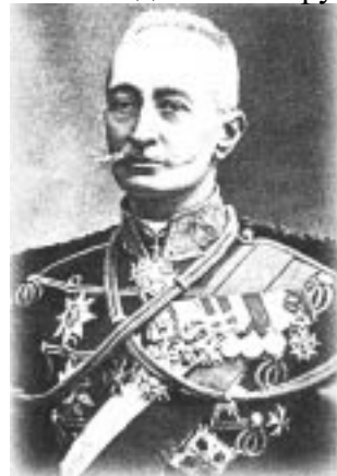
Алексей Алексеевич Брусилов, генерал от кавалерии (1853-1926 гг. жизни)

22 мая русская артиллерия начала обстрел австрийских позиций на юго-западном фронте, на следующий день корпуса 8-й русской армии прорвали оборону австрийцев. В истории это наступление русских армий юго-западного фронта, длившееся до августа, получило название «Брусиловский прорыв». В ходе наступательной операции в Галиции под командованием генерала А.А. Брусилова русские войска добились крупных успехов.