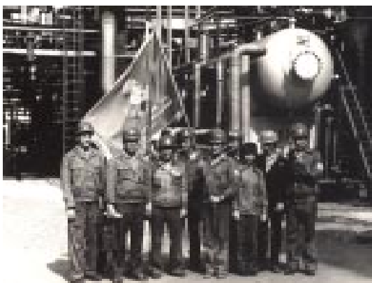
Коллектив установки ЗУ-70 с Красным Знаменем ЦК ВЛКСМ