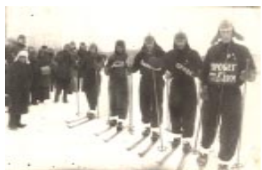
Пробег, посвященный X съезду ВЛКСМ. 1933 г.