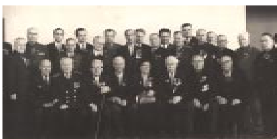
Делегаты XVI областной комсомольской конференции. 24 января 1968 года. Оренбург