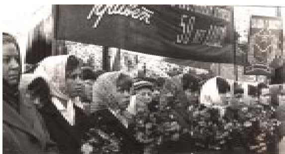
50 лет ВЛКСМ. 1968 год