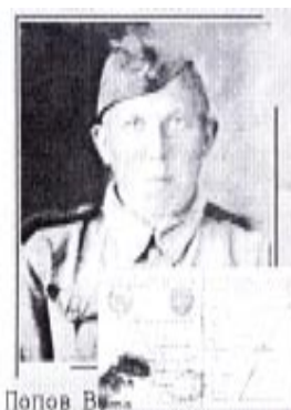
Попов В.И. уроженец поселка Хабаровского Оренбургской области Герой Советского Союза