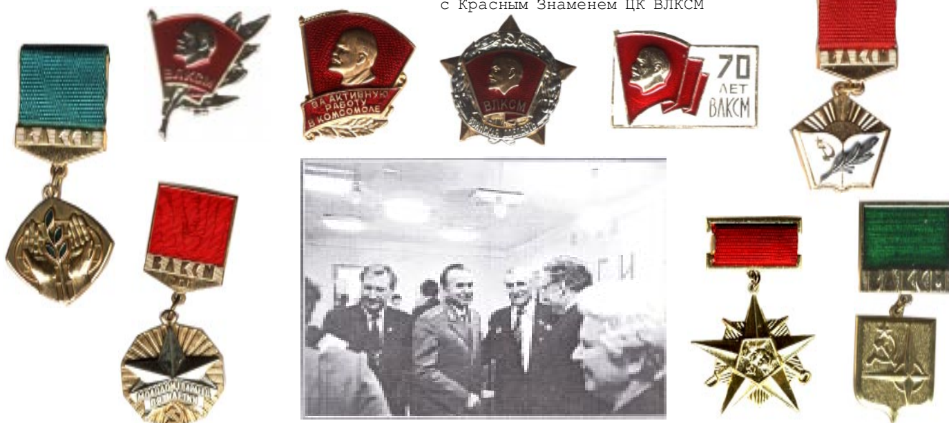
Празднование 70-летия ВЛКСМ