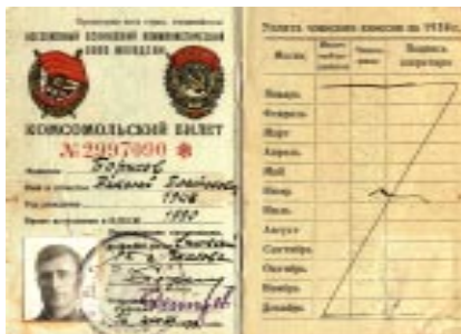
Комсомольский билет 30-х годов