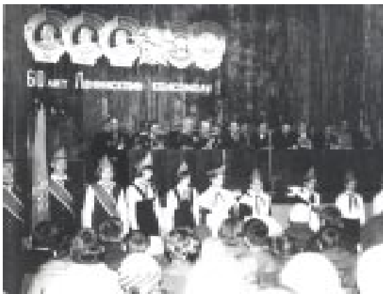
Торжественное собрание, посвященное 60-летию ВЛКСМ, г. Оренбург

Решением ЦК ВЛКСМ в апреле Оренбургское газоконденсатное месторождение было объявлено Всесоюзной ударной комсомольской стройкой. Вскоре сюда прибыл первый отряд добровольцев-комсомольцев.