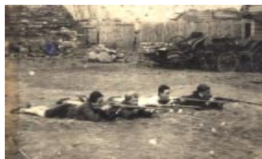
Готов к труду и обороне. 1932-1935 гг.