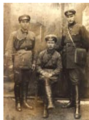
Комсомольцы. 1931 г.