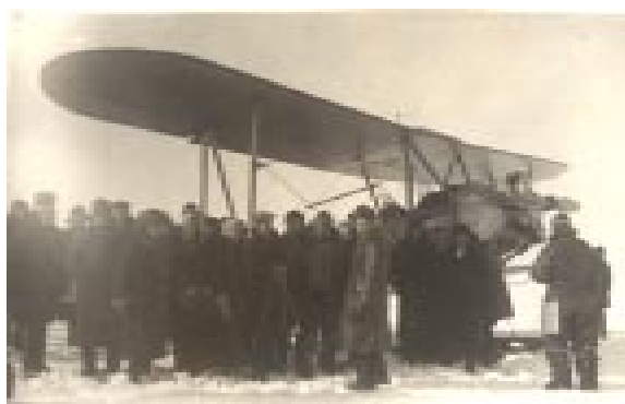
ОСОАВИАХИМ. 1930 год