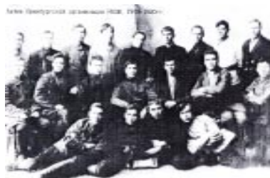
Актив Оренбургской организации РКСМ. 1919-1920 гг.