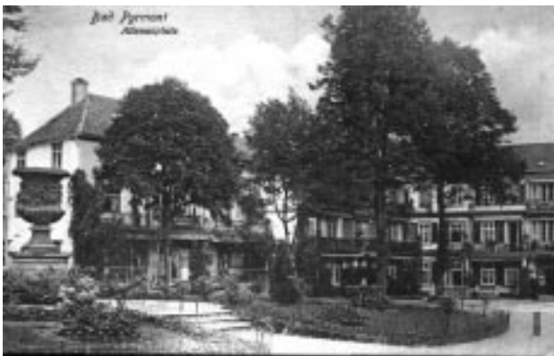
Bad Pyrmont Altenauplatz