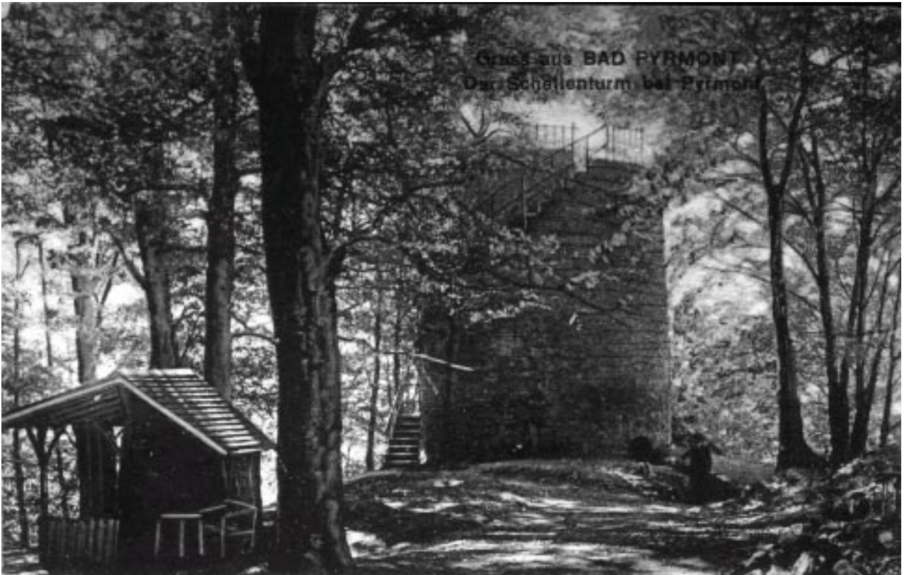
Gruss aus BAD PYRMONT Der Schellenturm bei Pyrmont