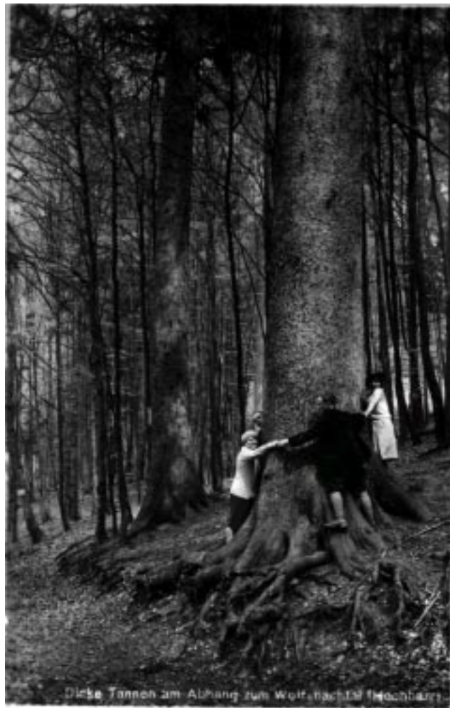
«Dicke Tannen» (Hochharz)