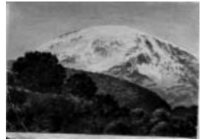
Südseite des Kibo (Kilimandscharo)