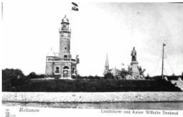
Holtenau Leuchtturm und Kaiser Wilhelm Denkmal