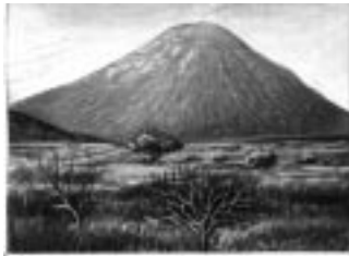
Der Dönjo Lengai