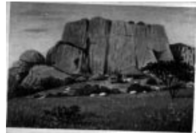
Granitfelsen am Marafluß