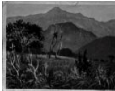
Nordabhang des Ulugurugebirges