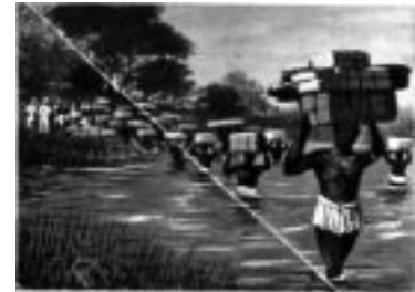
Überschreitung eines Flusses