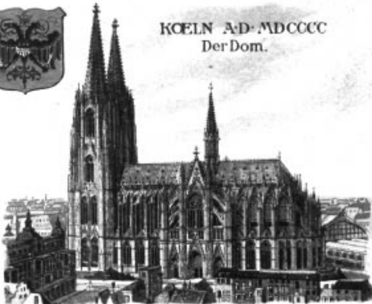
KOELN A.D. MDCCCC Der Dom.