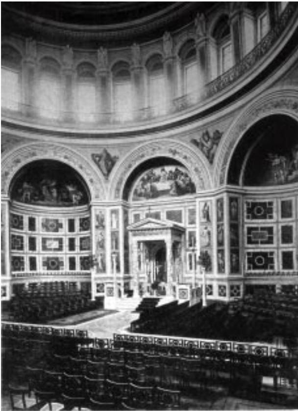
99 Berlin C. Königl. Schloss, Capelle.