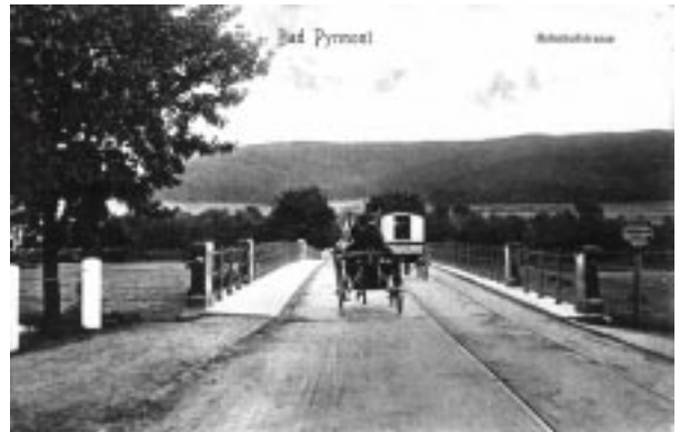
Bad Pyrmont Bahnhofstrasse