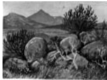
Landschaft im zentralen Uehe