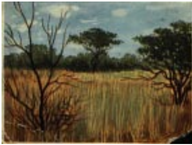
Steppenlandschaft im Hererolande