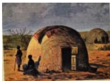
Pontok in Omaruru