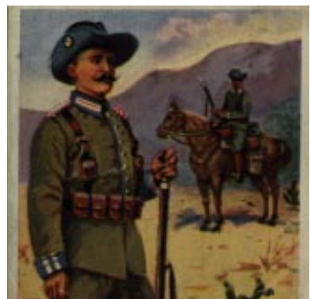
Reiter der Schutztruppe