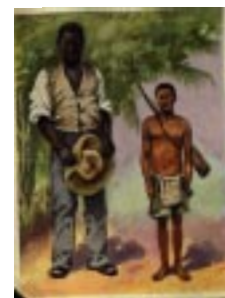
Herero und Buschmann