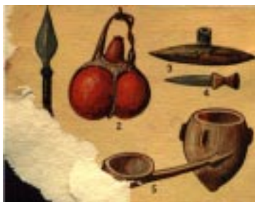
Waffen und Geräte