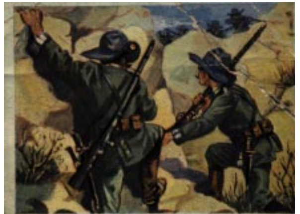
Angriff bei Alurifontein