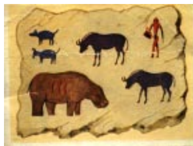
Kultur der Buschmänner