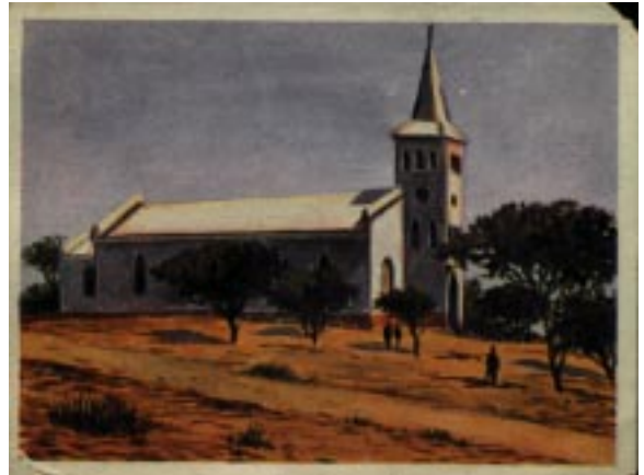
Kirche der Eingeborenen in Windhuk