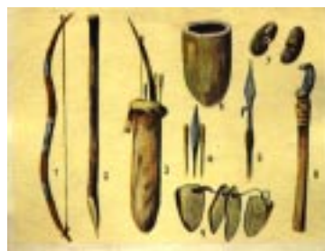
Buschmann-Waffen und - Geräte