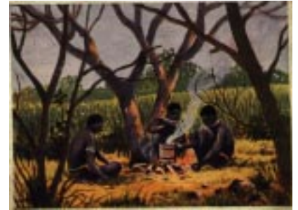
Ovambo am Feuer