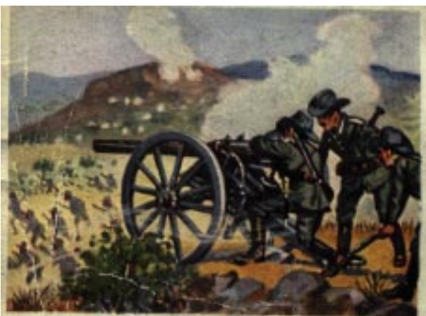
Artillerie im Gefecht bei Hamakari