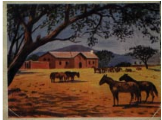
Farm in Deutsch-Südwestafrika