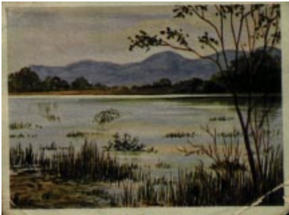
Stausee bei Windhuk