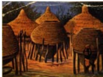
Kornbehälter im Ambolande