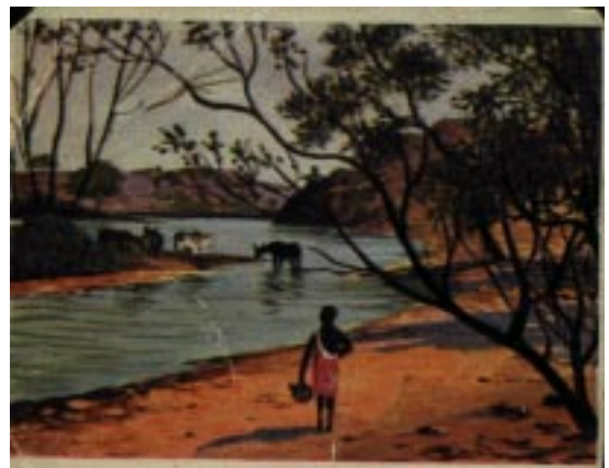
Staudamm auf der Farm Hoffnung