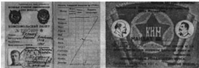
Комсомольский билет 30-х годов

Вместе с работниками детской комнаты милиции члены ОКО проверяли по месту жительства подростков, склонных к пра-