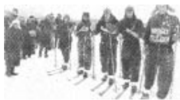
Пробег, посвященный X съезду ВЛКСМ. 1933 г.