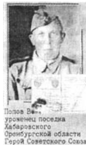
Полов В. — уроженец поселка Хабаровского Оренбургской области Герой Советского Союза