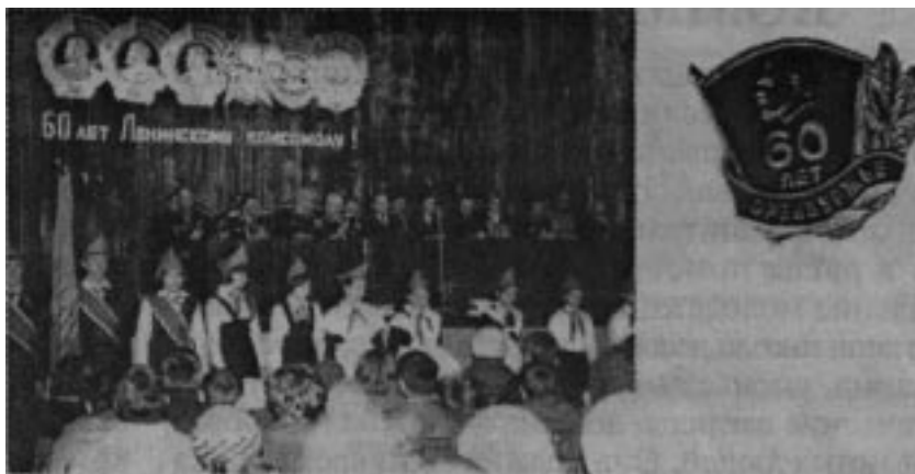
Торжественное собрание, посвященное 60-летию ВЛКСМ. г. Оренбург