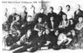
Актив Оренбургской организации РКСМ. 1919-1920 гг.