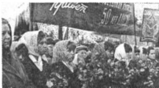
50 лет ВЛКСМ, 1968 год