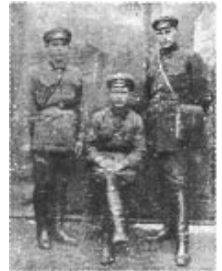
Комсомольцы 1931 г.