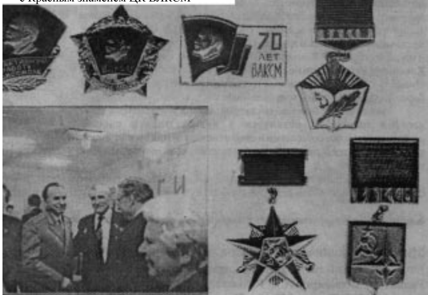
Празднование 70-летия ВЛКСМ