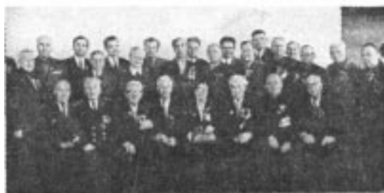
Делегаты XVI областной комсомольской конференции. 24 января 1968 г. Оренбург