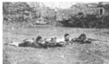
Готов к труду и обороне, 1932-1935 гг.