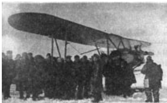
ОСОАВИАХИМ, 1930 год