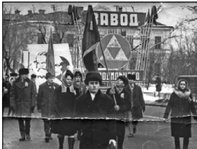
Коллектив завода в советское время на демонстрации, посвященной годовщине Великой Октябрьской социалистической революции

продукции. Вот завод и рухнул! Главная задача руководства, по сведениям бывших сотрудников предприятия, – прокатиться, (еще когда завод работал), на заводские деньги за границу, якобы, для обмена опытом, (в частности известно, что в США), распродать все имущество завода и жить в свое удовольствие.