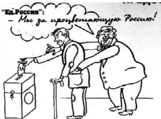
рис. В. ЧЕРЕДОВА (Барнаул)

На почве простодушия народа Как много горя, бед, вреда и зла Тебе и мне с 2000 года «Единая Россия» принесла!