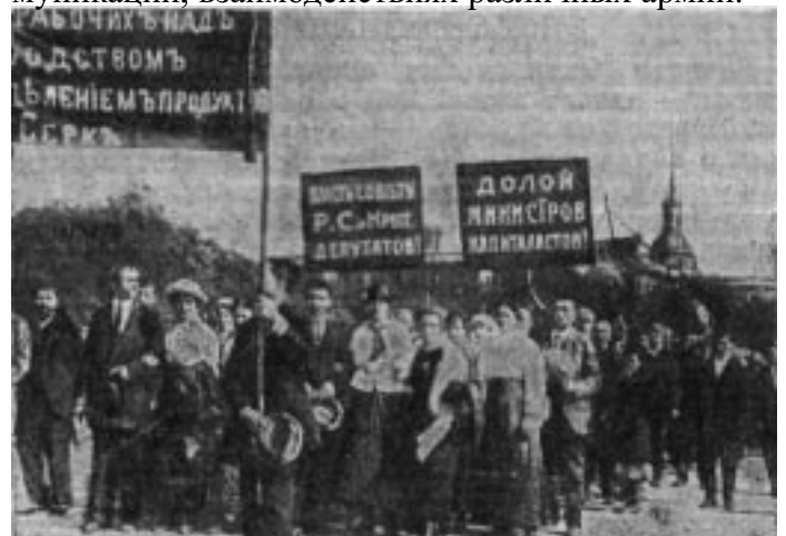
Демонстрация трудящихся Петрограда 18 июня 1917

Ценой больших потерь (за 20 дней боев российские войска Юго-Западного фронта потеряли около 60 тысяч чел.) удалось занять несколько городов (Галич, Калуш, Станислав) и выйти на реку Ломница. Однако дело было не в большевистской пропаганде, а в том, что наступление не было подготовлено, наблюдалась большая сложность в подвозе боеприпасов, создании соответствующих коммуникаций, взаимодействиях различных армий.