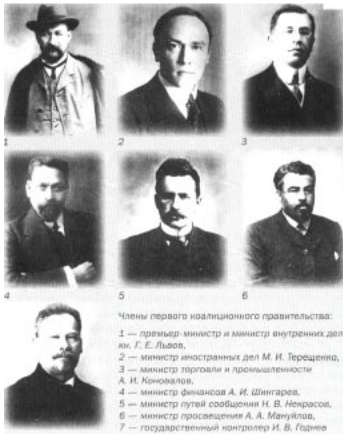
Члены первого коалиционного правительства:

советы рабочих и крестьян. Некоторые города и районы объявлялись Советскими республиками. Фабричные комитеты рабочих провозглашали себя единственными хозяевами предприятий. Крестьяне захватывали землю и делили ее между собой. А все остальное заслонялось всеобщим желанием мира, прекращения бессмысленной, кровавой, ужасной войны. В военных подразделениях, крупных и мелких - от дивизий до рот, создавались сол-