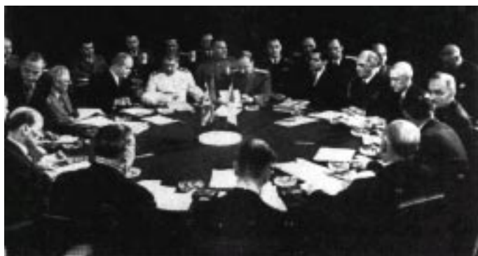
Участники Потсдамской конференции

17 июля по 2 августа в Потсдаме, пригороде Берлина во дворце Цецилиенхоф, проходила конференция глав правительств главных держав-победительниц: СССР (И.В. Сталин), США (Г. Трумэн) и Великобритании (У. Черчилль, с 28 июля, после победы на выборах лидера Лейбористской партии, — К. Эттли). Приняты решения о демилитаризации Германии, об уничтожении германских монополий, и репарациях, о западной границе Польши. Главное место на конференции заняла германская проблема. Было принято решение о полном разоружении Германии, упразднении всех её вооружённых сил, СС, СА, СД и гестапо, ликвидации военной промышленности. В то же время предусматривалась реконструкция политической жизни Германии на демократической основе. В решениях Берлинской конференции говорилось, что союзные державы «не намерены уничтожить или ввергнуть в рабство немецкий народ». В Потсдаме, в отличие от Крымской (Ялтинской) конференции 1945 г., не рассматривался вопрос о расчленении Германии. Было принято решение о подготовке и скорейшем проведении суда над главными нацистскими преступниками. Специально для управления Германией был создан Контрольный совет, осуществлявший коалиционный контроль со стороны держав-победительниц. Кенигсберг (с 1946 г. Калининград) с прилегающим к нему районом передавался СССР. Советской стороной было подтверждено обязательство об участии СССР в войне против Японии. Трумэн сообщил Сталину о создании атомной бомбы.