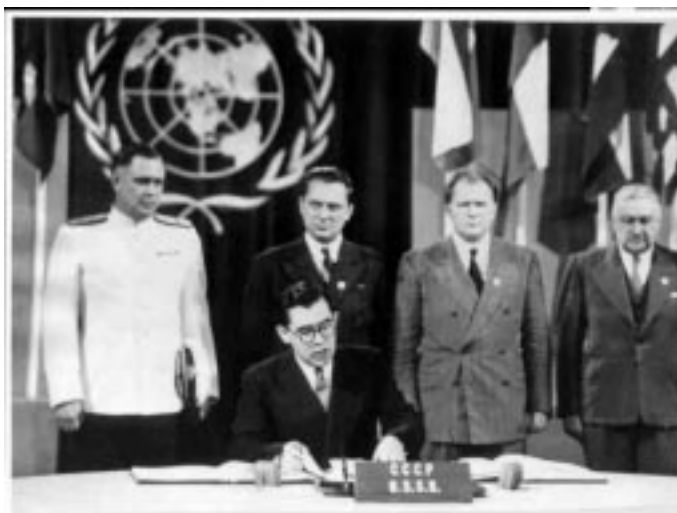
Подписание Устава Организации Объединённых Наций

26 октября в Москве умер А.Н. Крылов, математик, кораблестроитель, Герой Соцтруда.