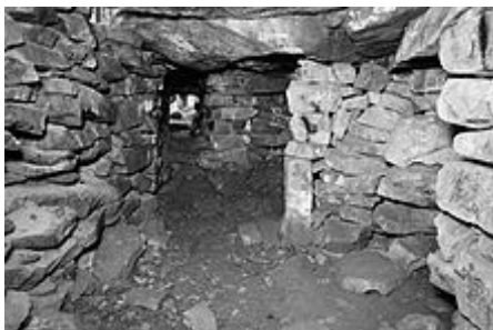
Один из мегалитов острова Веры

Мегалиты острова Веры — комплекс археологических памятников (мегалитов — камерной гробницы, дольменов и менгиров) на острове озера Тургояк (около Миасса) в Челябинской области. Древнейшие на Земле мегалиты сооружены предположительно около 6 тысяч лет назад, в IV тыс. до н. э., то есть до знаменитого Стоунхенджа в Англии (5 тысяч лет назад, III тыс. до н.э.).