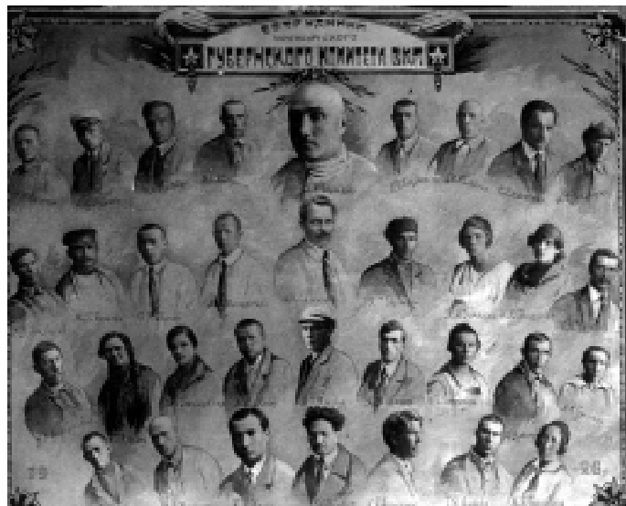
Сотрудники Оренбургского губернского комитета ВКП(б) 1926 год: 8 – женщин и 26 – мужчин

Использованы материалы из книги «Очерки истории Оренбургской областной организации КПСС», Челябинск, Южно-Уральское книжное издательство, 1983