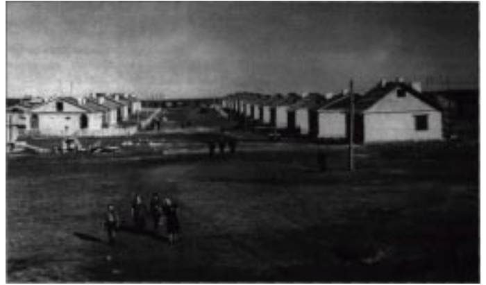
Улица Целинная. Первая улица, построенная сельскими строителями. Адамовский район, 1956 г.

Вьется дорога длинная, Здравствуй, земля целинная, Здравствуй, простор широкий, Весну и молодость встречай свою!